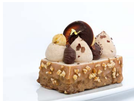
Tarta de Ferrero Rocher