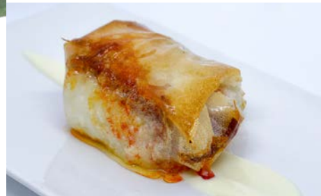
Samosa de bacalao