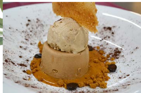
Carajillo de Baileys