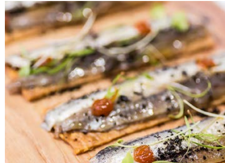
Matrimonio de boquerón y anchoa