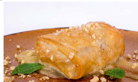
Pástela de Vaca brava