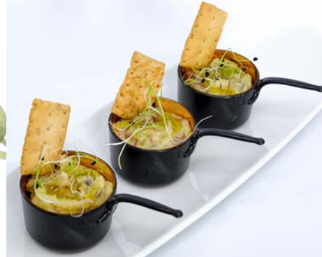
Ensaladilla escabechada de pollo de corral

IVA, Minutas, Decoración de mesas, Muñeco de la tarta, Hinchable, Barredera y suelta de vaquillas Desde mayo hasta los fines de semana de junio antes del Corpus