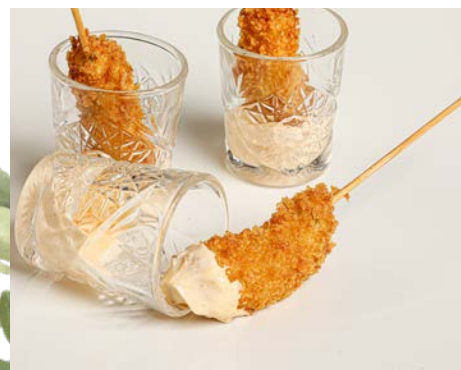
Piruleta de langostino