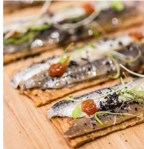
Matrimonio de boquerón y anchoa