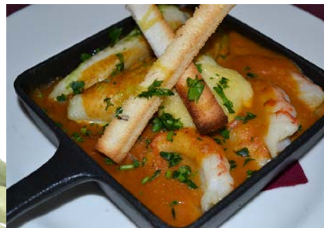
Suquet de rape y langostinos