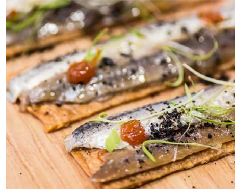
Matrimonio de boquerón y anchoa