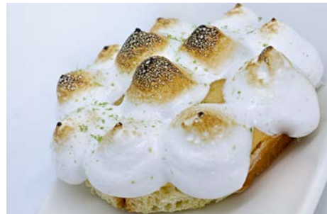
Tarta Lemon Pie