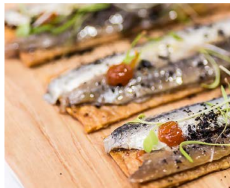
Matrimonio de boquerón y anchoa