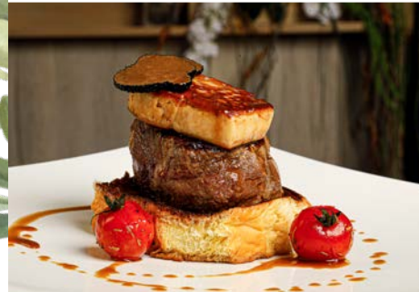
Solomillo de Vaca Rossini