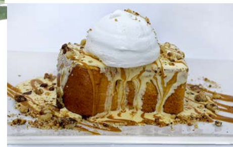
Torrija caramelizada con Toffee