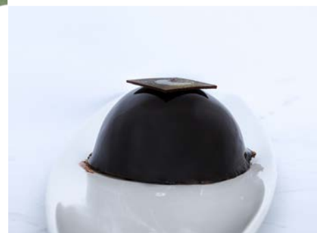
Tarta de Chocolate y Caramelo