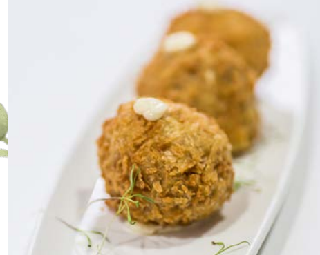
Croqueta de cecina e higos

IVA, Minutas, Decoración de mesas, Muñeco de la tarta, Hinchable, Barredera y suelta de vaquillas Desde mayo hasta los fines de semana de junio antes del Corpus