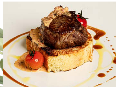
Solomillo de ternera lechal y salsa ibérica