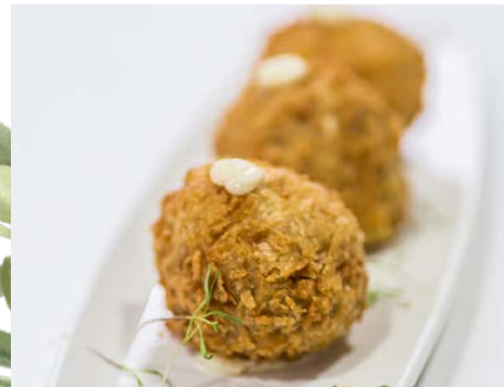
Croqueta de cecina e higos