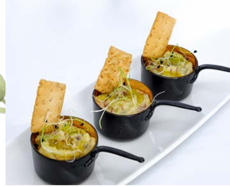
Ensaladilla escabechada de pollo de corral

IVA, Minutas, Decoración de mesas, Muñeco de la tarta, Hinchable, Barredera y suelta de vaquillas Desde mayo hasta los fines de semana de junio antes del Corpus